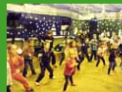
Szkolne imprezy Więcej na stronie 12.