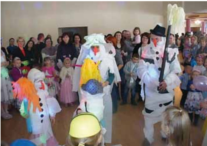
Przedzkolaczki miały fantastyczną zabawę karnawałową.

Dzieci nie tylko się bawią, ale i pamiętają o swoich babciach i dziadkach. 21 stycznia przedszkolaczki przygotowały uroczystość właśnie z okazji Dnia Babci i Dziadka. Najpierw została odprawiona msza święta w kościele parafialnym w Przytyku, w intencji wszystkich babć i dziadków. Następnie przedszkolaki śpiewały piosenki i recytowały wiersze. Potem złożyły życzenia swoim najbliższym. Po występach zaproszeni goście zostali poczęstowani słodkim upominkiem. Nie zabrakło też pamiątkowych fotografii i uścisków.