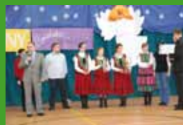
Anielskie śpiewanie Więcej na stronie 11.