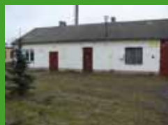
Zbudują świetlicę Więcej na stronie 5.