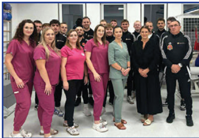
Zawodnicy Klubu Sokół Przytyk wraz z pracownikami Ośrodka Zdrowia w Przytyku podczas oficjalnego spotkania podsumowującego rozpoczętą współpracę w zakresie fizjoterapii i regeneracji sportowej.