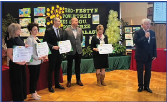
Uroczyste rozdanie nagród w konkursie.

Ekologia i nowoczesne inwestycje to priorytet naszego samorządu. W gminie Przytyk przykładamy dużą wagę do działań, które nie tylko chronią środowisko, ale też poprawiają komfort życia mieszkańców. Szczególną uwagę zwracamy na warunki w szkołach, aby uczniowie mogli uczyć się w bezpiecznym, zdrowym i nowoczesnym otoczeniu.