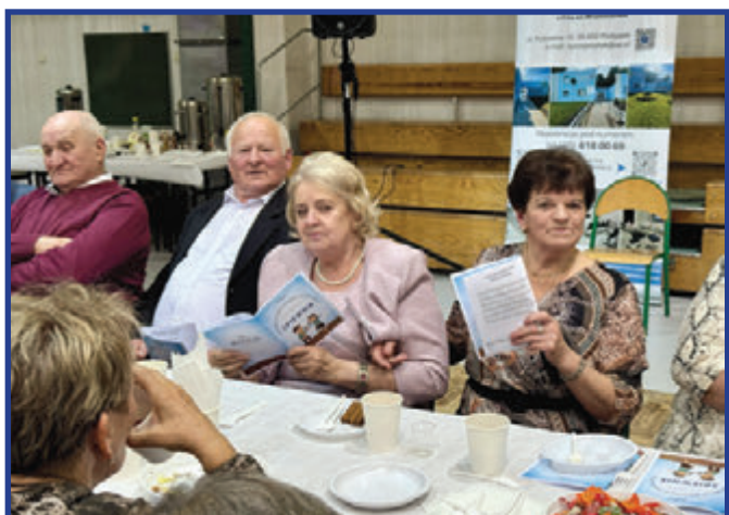
Uroczystość sprzyja integracji i budowaniu więzi międzypokoleniowych, a także pokazuje, że aktywność i wspólna zabawa nie mają wieku.