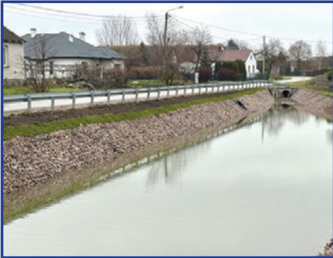
Staw w Glinicach w nowej odsłonie.

W Glinicach zakończono ważną inwestycję – odbudowę miejscowego stawu. Projekt został zrealizowany w ramach Krajowego Planu Odbudowy (KPO), w zakresie przedsięwzięcia wspierającego zrównoważoną gospodarkę wodną na obszarach wiejskich.