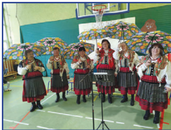
Wrzosowianki na Dniu Pieczonego Ziemniaka.