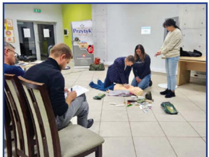
Jedno ze szkoleń odbyło się w dniu 9 grudnia w Centrum w Słowikowie.