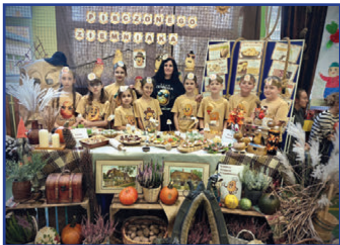
Klasa IV z wychowawczynią w czasie Dnia Pieczonego Ziemniaka.

29. października 2025 r., w PSP im. Orła Białego we Wrzosie, odbyło się jedno z najbardziej wyczekiwanych i radosnych wydarzeń tej jesieni – Dzień Pieczonego Ziemniaka – święto smaku, tradycji i wspólnej zabawy, współorganizowane ze Stowarzyszeniem „Wrzosowisko”. Partnerem imprezy oraz fundatorem cennych nagród dla zwycięzców różnorodnych konkursów był Samorząd Województwa Mazowieckiego, Mazowsze serce Polski.