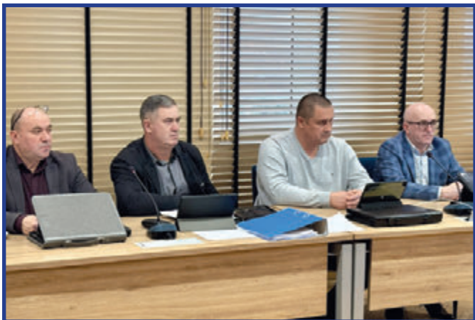
Sesja Rady Miejskiej w Przytyku z dnia 26 listopada 2025 r.

W środę, 26 listopada, odbyła się XVIII sesja Rady Miejskiej w Przytyku. Podczas obrad radni zajęli się m.in. ustaleniem wysokości podatków na 2026 rok. Radni jednogłośnie zatwierdzili stawki zaproponowa-