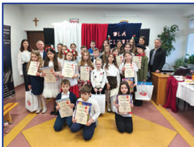
Zwycięcy oraz uczestnicy konkursu.