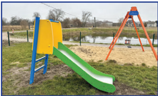
Zjeżdżalnia w Woli Wrzeszczowskiej.

Rok 2025 był czasem intensywnej pracy nad lokalnymi inwestycjami w ramach funduszu sołeckiego. Mieszkańcy naszej gminy, wraz z sołtysami i radami sołeckimi, zdecydowali o przeznaczeniu środków na różnorodne przedsięwzięcia w swoich sołectwach. Dzięki temu w wielu miejscowościach udało się wyrownać drogi gruntowe, co znacząco poprawiło kom-