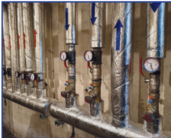
Zmodernizowana część kotłowni Urzędu Miejskiego.