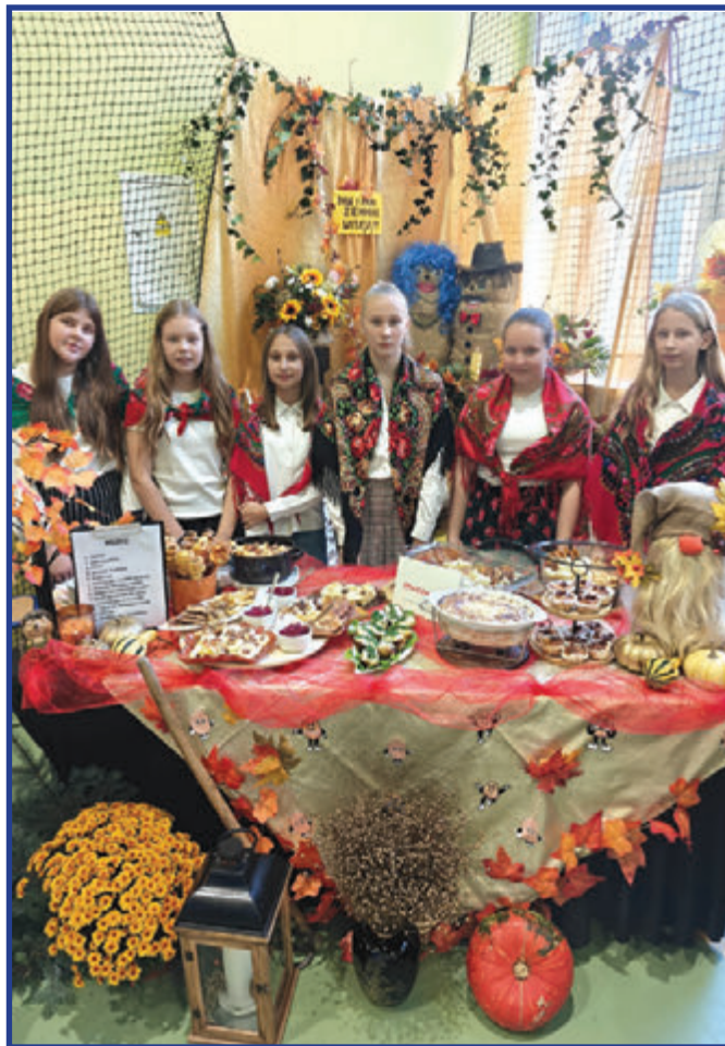
Uczennice klasy VI prezentują swoje stoisko.