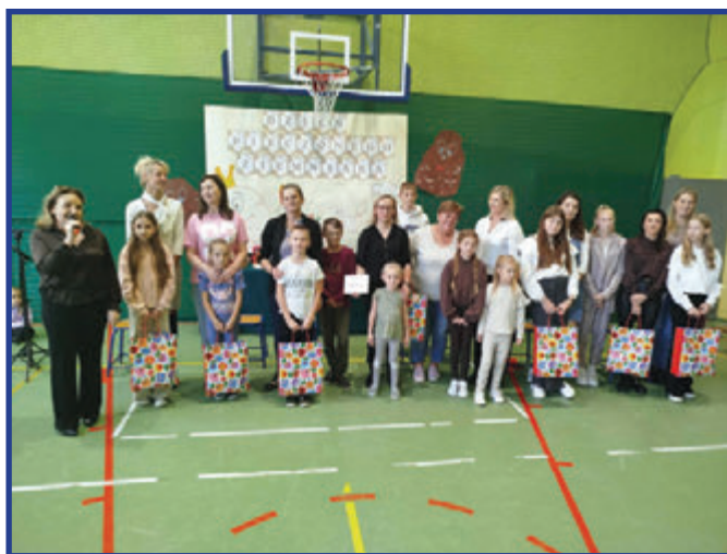
Nagrodzeni w rodzinnym quizie wiedzy o ziemniaku.