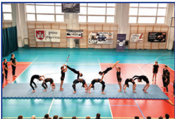
Pokaz akrobatyki sportowej - młodzi zawodnicy prezentują układ zespołowy wymagający siły, równowagi i współpracy.

Akrobatyka sportowa to jedna z najbardziej wszechstronnych form aktywności fizycznej rozwijających ciało i umysł. W Miejskim Centrum Kultury w Przytyku zajęcia te, z roku na rok, cieszą się coraz większą popularnością, przyciągając dzieci i młodzież na zajęcia, które to uczą ich pokonywania swoich słabości, samodyscypliny, a dodatkowo dają ogromną satysfakcję.