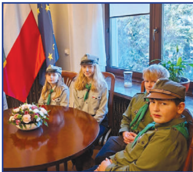
Dzieci w pomieszczeniach sejmowych.