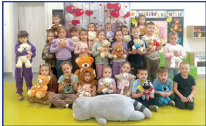
Przedszkolaki z misiami.