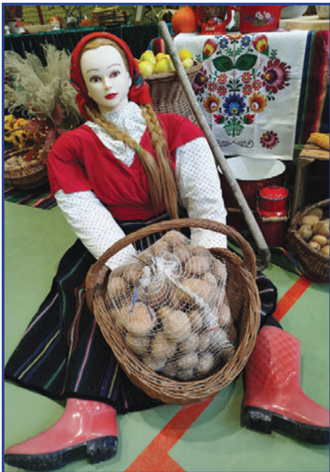
Ziemniaczana baba klasy I.