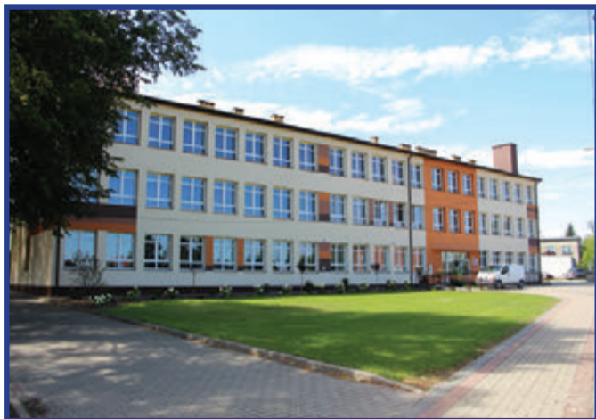
PSP w Przytyku po modernizacji.