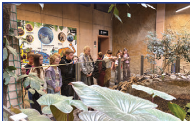
Wizyta w łódzkim zoo.