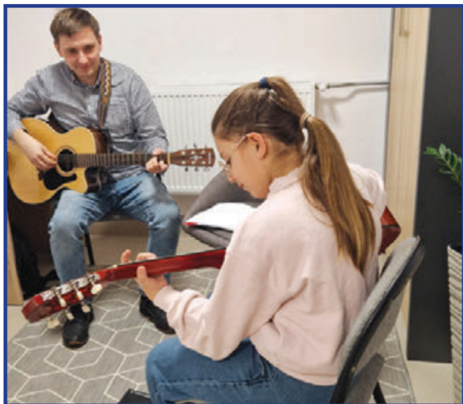
Indywidualna nauka gry na gitarze w MCK.