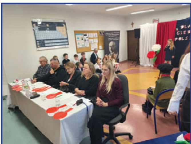
Komisja konkursowa podczas przesłuchań.