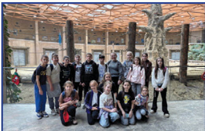
„Wyjście z klasą” - uczniowie PSP we Wrzeszczowie.

Uczniowie ze szkół podstawowych w Przytyku, Wrzosie i Wrzeszczowie biorą udział w programie „Wyjście z klasą”, realizowanym przez Ministerstwo Edukacji Narodowej. Projekt wspiera organizację jednodniowych wyjść edukacyjno-kulturalnych, umożliwiając dzieciom kontakt z instytucjami kultury, miejscami pamięci i dziedzictwem narodowym.