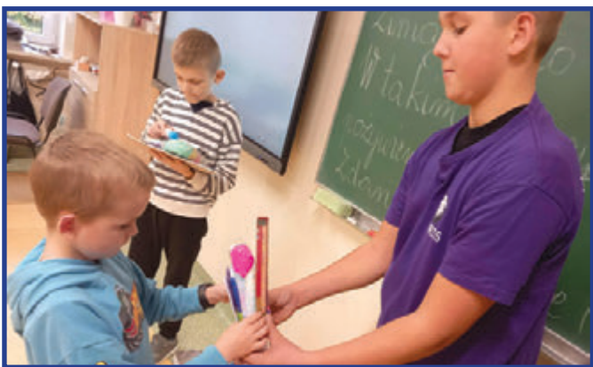
Dzieci przekazują przybory szkolne.

W październiku br. Szkolne Koło Wolontariatu, działające w Publicznej Szkole Podstawowej im. Orła Białego we Wrzosie, zorganizowało akcję pod hasłem „Piórniki dla Afryki”. To wyjątkowa inicjatywa charytatywna, której celem jest wsparcie dzieci z najuboższych regionów Afryki poprzez dostarczanie im podstawowych przyborów szkolnych. Choć dla wielu z nas piórnik, długopis czy kredki są czymś oczywistym, dla tysięcy uczniów w krajach afrykańskich stają się luksusem – a często wręcz warunkiem możliwości nauki.