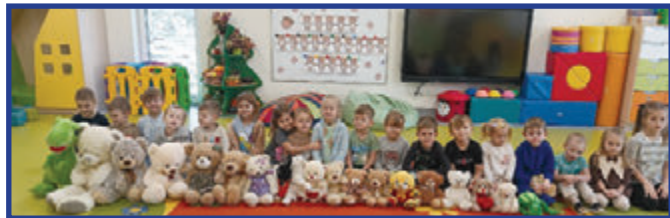
Grupa Żabki i ich misie.