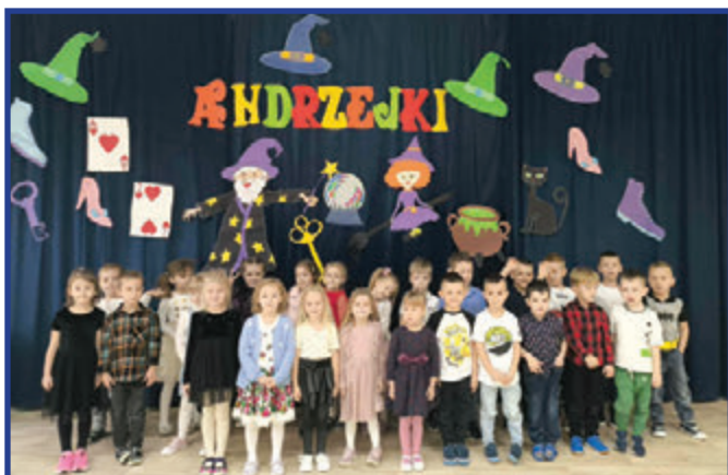
Andrzejki w przedszkolu.

Zwyczaj wróżenia w wieczór andrzejkowy znany jest od bardzo dawna. Pamiętajmy jednak, że wróżba to zabawa i nie należy traktować jej poważnie, chociaż nie jest wykluczone, że może się spełnić.