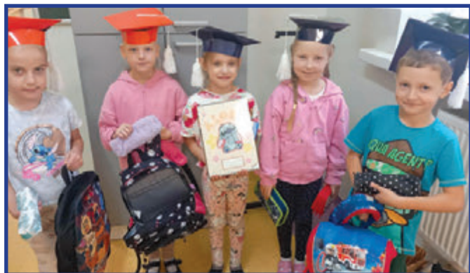
Uczniowie klasy I pomagają.