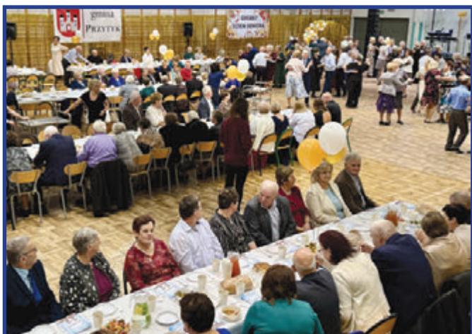
Muzyka na żywo to obowiązkowy element naszego Gminnego Dnia Seniora.

Druga sobota listopada była wyjątkowym dniem dla seniorów z gminy Przytyk. W hali Publicznej Szkoły Podstawowej odbył się VIII Dzień Seniora, który zgromadził blisko 300 osób powyżej 65. roku życia. Wydarzenie, zorganizowane przez samorząd, okazało się wspaniałą okazją do świętowania, integracji i wspólnej zabawy.