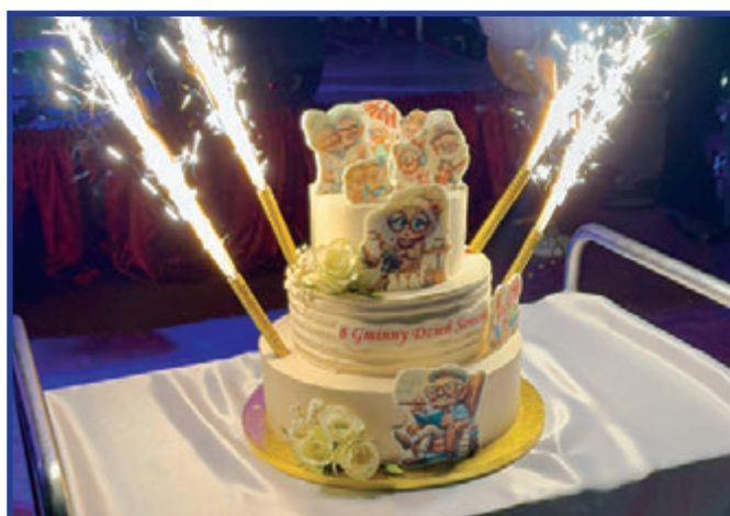
Tematycznie udekorowany tort, był kolejną niespodzianką dla najstarszych mieszkańców naszej gminy.