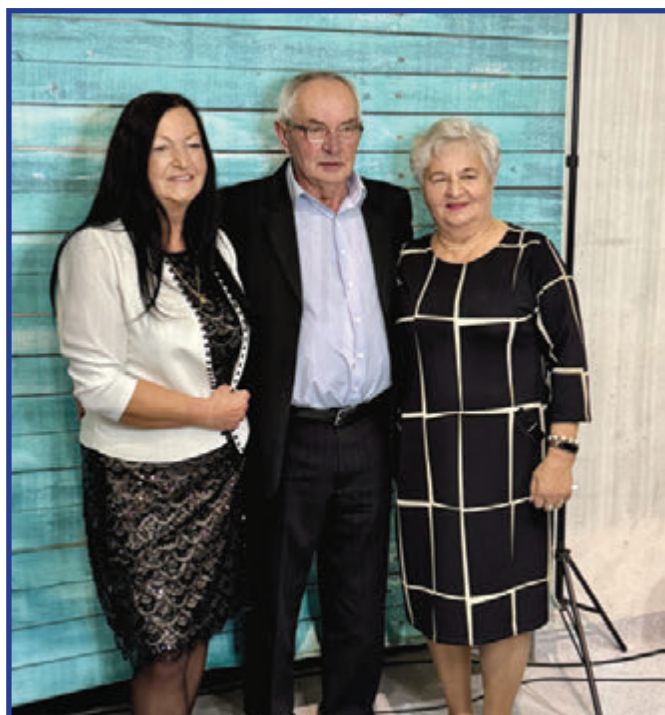
Tak jak w latach ubiegłych, dużym zainteresowaniem cieszyła się fotobudka.