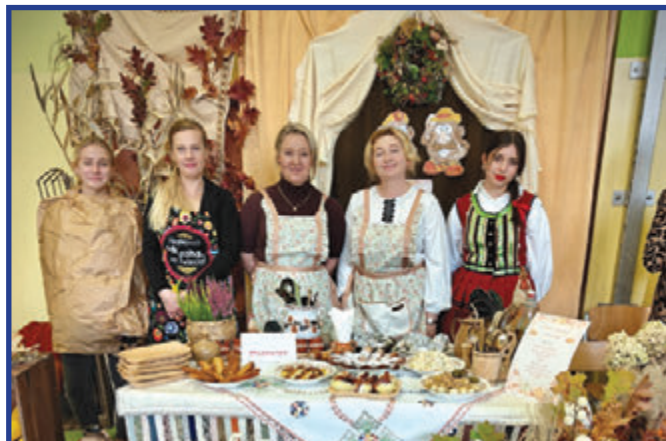
Stoisko klasy VIII.