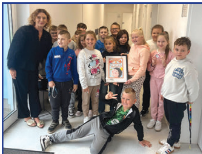
Uczniowie klasy III b z Publicznej Szkoły Podstawowej w Przytyku podczas bezpłatnego przeglądu stomatologicznego w Ośrodku Zdrowia.