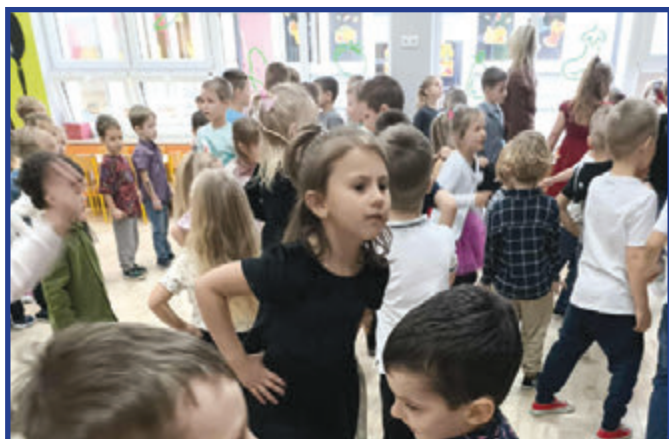
Czas na tańce.