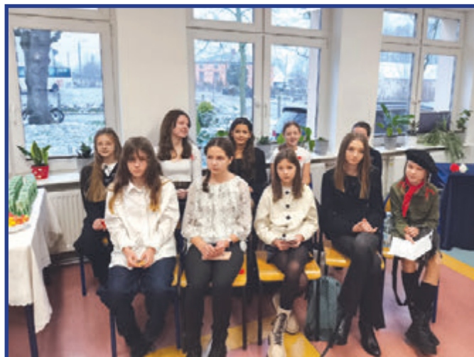
W oczekiwaniu na werdykt.