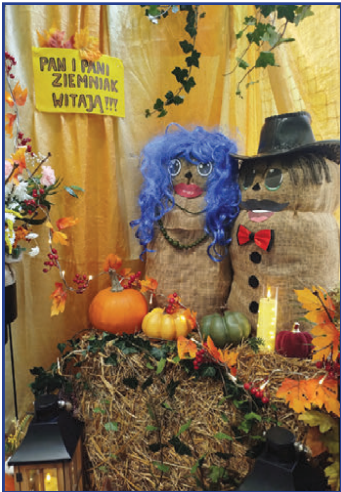
Pani i Pan Ziemniak - stoisko klasy VI.