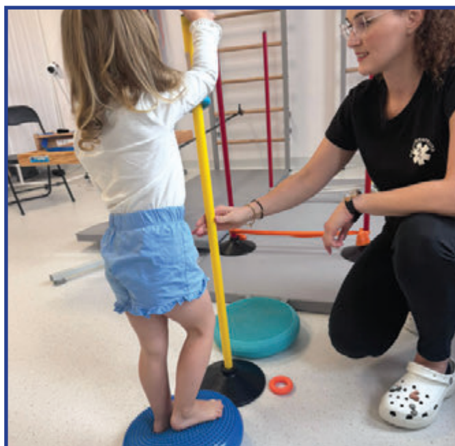
Terapie dopasowane do potrzeb najmłodszych pomagają wrócić do pełnej sprawności i wspierają prawidłowy rozwój.