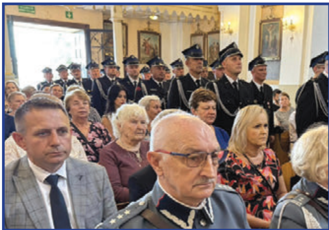
Jubileusz istnienia OSP to okazja do uhonowania pracy i poświęcenia strażaków niosących pomoc naszym mieszkańcom.