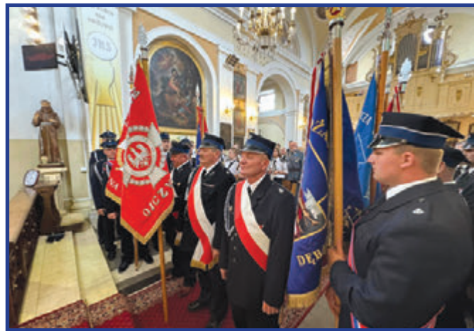
Uroczystości rozpoczęła msza św. odprawiona w intencji druhów ochotników.