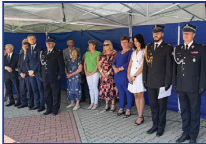
Zaproszeni goście biorący udział w apelu z okazji 100-lecia jednostki.