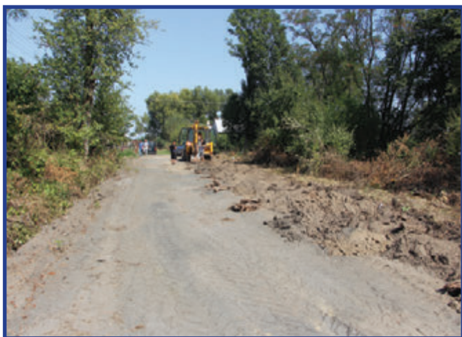
Prace nad przebudową drogi.

Przebudowa miała na celu usprawnienie komunikacji i poprawę warunków życia w tej części miejscowości.