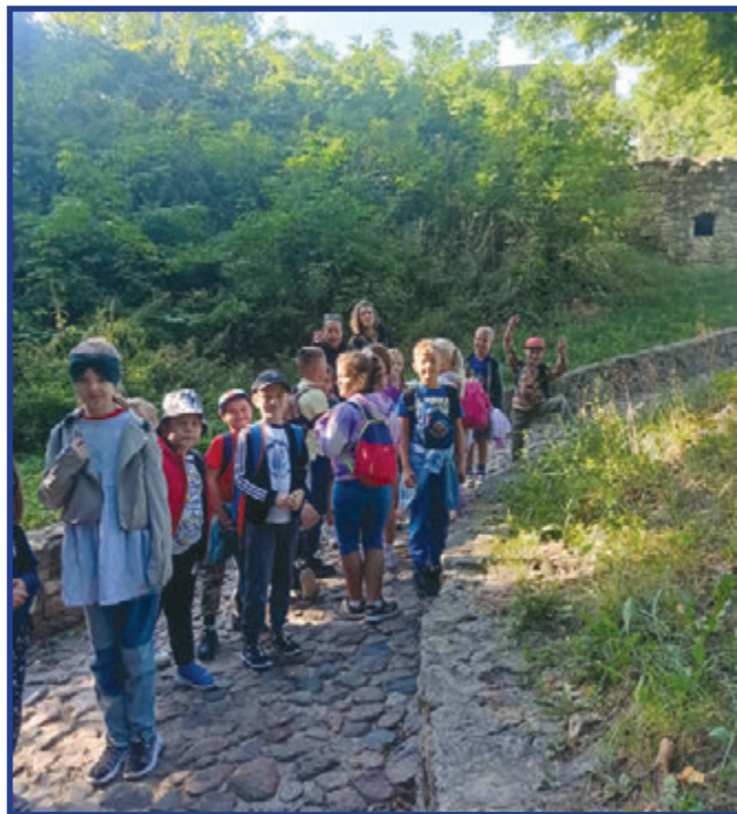
Wędrówka na zamek w Iłży.