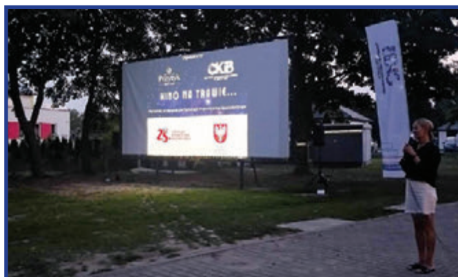
Organizatorzy i partnerzy wydarzenia Kino na trawie.