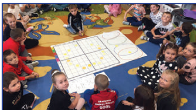
Zabawy z kropkami Biedronek.