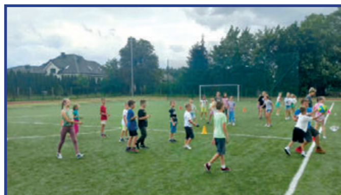
Zajęcia sportowe podczas półkolonii.