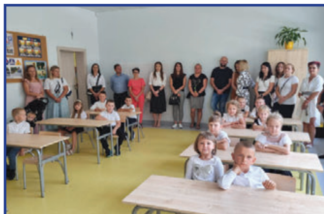
Pierwszoklasiści rozpoczynający nowy rok szkolny.