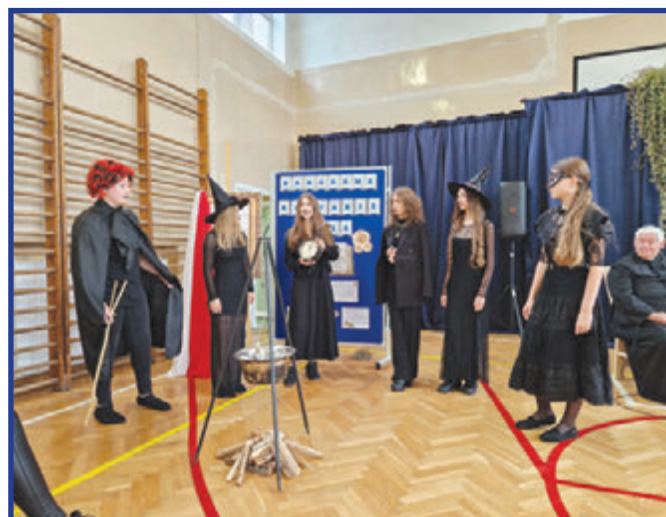
Inscenizacja wybranej scenki z „Kordiana” przygotowana przez młodzież z PSP w Przytyku.

ciło uwagę na wymiar literackiego dziedzictwa narodowego. Narodowe Czytanie jest już tradycją w naszej gminie, bowiem pierwsza edycja miała miejsce w 2018 roku. Warto pielęgnować tradycje, które pozwalają na twórcze i głębokie przeżywanie kultury.