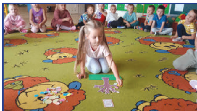
Drzewo kropczkowe Krasnoludków.