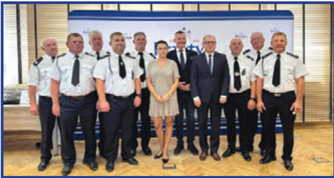
Druhnym i druhom z OSP Wrzos, Wrzeszczów, Suków, Przytyk, Dęba, Domaniów i Goszczewice otrzymano specjalistyczny sprzęt i umundurowanie.

Do druhen i druhów z siedmiu jednostek OSP w naszej gminie trafił specjalistyczny sprzęt i środki ochrony indywidualnej niezbędne do codziennej pracy.