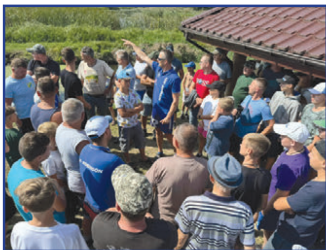
Przed zawodami odbyła się odprawa uczestników oraz losowanie stanowisk.