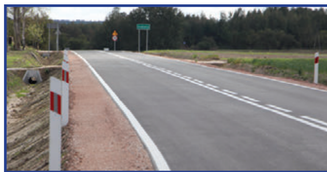
Wyremontowana droga powiatowa.