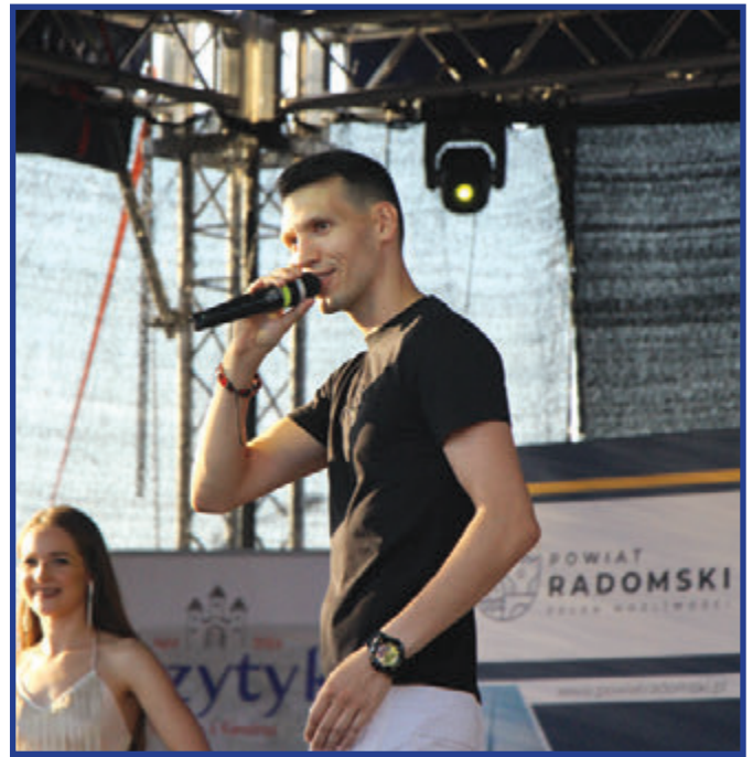
Koncert zespołu Bayera był jednym z elementów programu tegorocznych targów.