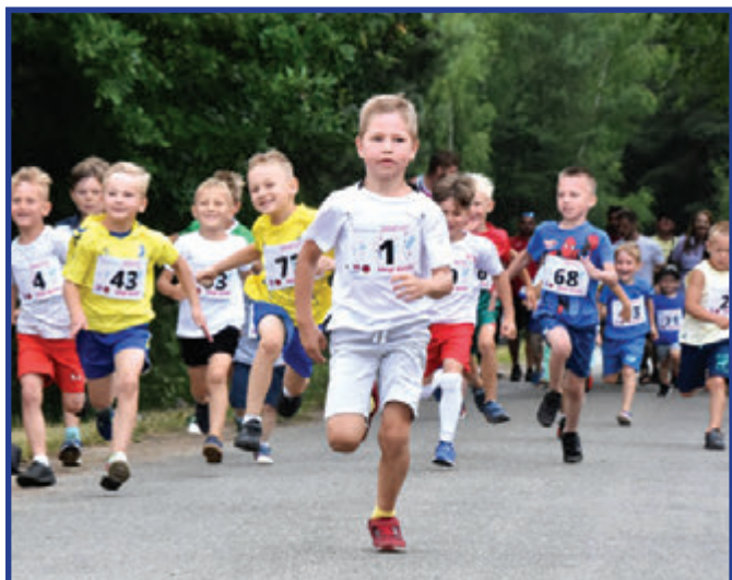
Młodzi uczestnicy biegu z ogromnym zaangażowaniem rywalizowali o medale podczas festynu „Powitanie lata” nad zalewem Jagodno.

Festyn „Powitanie lata” nad zalewem Jagodno przyciągnął wielu mieszkańców i turystów, oferując mnóstwo atrakcji zarówno dla dzieci, jak i dorosłych. Mimo zmiennej pogody, która kilkakrotnie przyniosła deszcz, wydarzenie zapewniło uczestnikom doskonałą zabawę i mnóstwo niezapomnianych wrażeń.