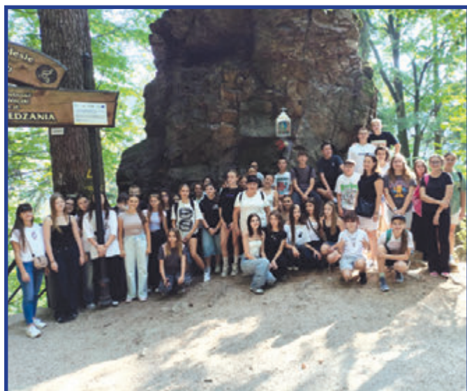
Wycieczka do wodospadu Wilczki.