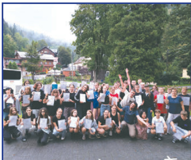
Rozdanie dyplomów na zakończenie obozu.