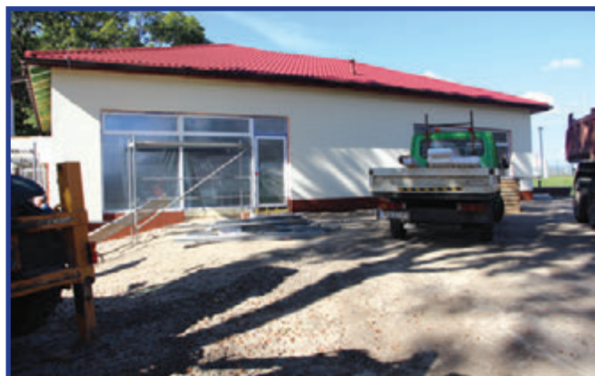
Obecny stan rozbudowywanej części placówki.