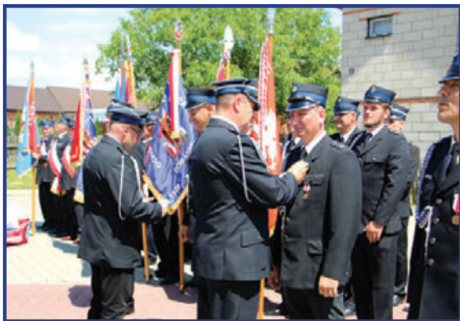
Podczas uroczystości wręczono strażakom odznaczenia związane z wzorową postawą i służbą.