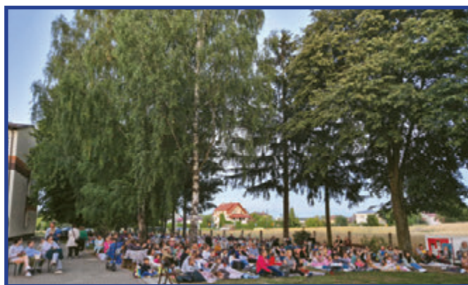
Ogromny sukces pokazów plenerowych przy CKiB w Przytyku.