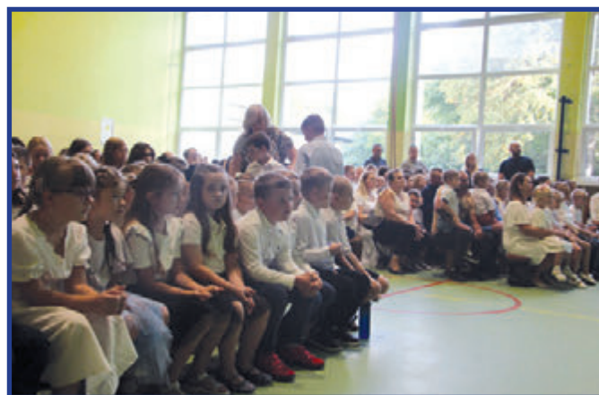
Uczniowie czekający na pierwszy dzwonek.