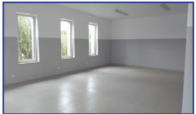
Wyremontowana sala w Sukowie.