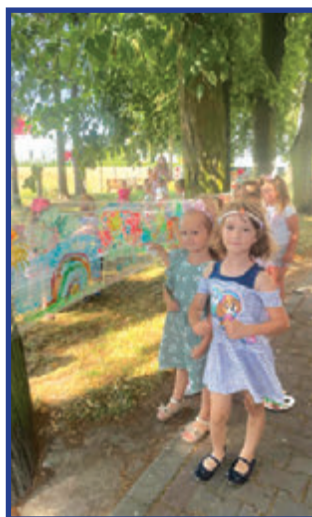
Wakacyjne malowanie na folii.