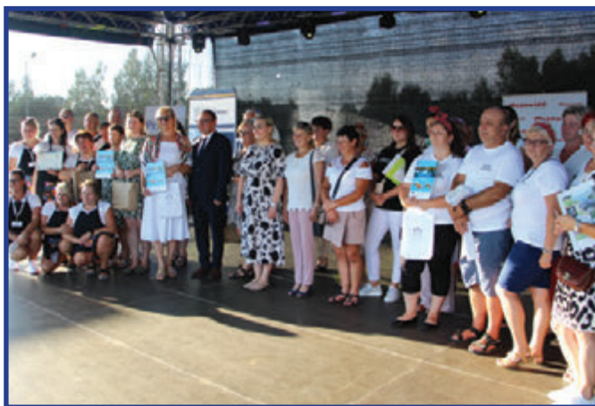
Uczestnicy konkursu kulinarnego.