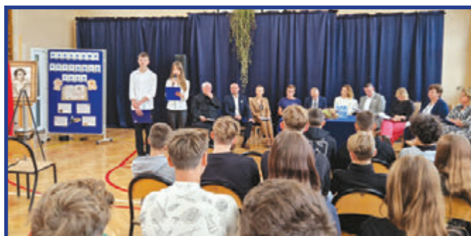
Narodowe Czytanie edycja 2024.

Należy podkreślić, że Narodowe Czytanie to nie tylko hołd dla polskiej literatury, ale także sposób na integrację mieszkańców i wspólne przeżywanie piękna słowa pisanego. Wydarzenie przybliżyło postać Kordiana i zwró-