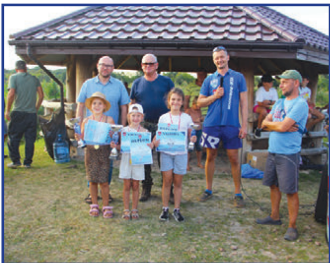
Zwycięzynie kat. dzieci.