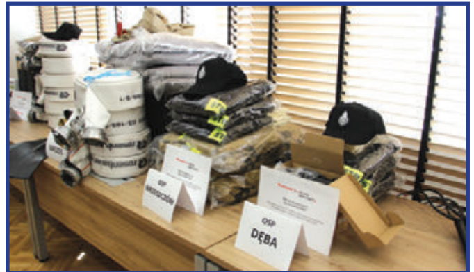
Na zakup sprzętu, samorząd województwa mazowieckiego przeznaczył 26 tys. zł, pozostałe środki wynoszące 30 tysięcy złotych pochodzą z budżetu gminy Przytyk.