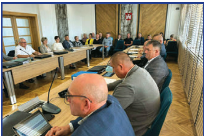
IV Sesja Rady Miejskiej w Przytyku.

Zgodnie z oczekiwaniami mieszkańców, przedstawionymi podczas tegorocznych zebrań sołeckich, Rada Miejska w Przytyku uchwałą nr II.12.2024 z dnia 24 maja 2024 roku zdecydowała o przeprowadzeniu konsultacji społecznych dotyczących zmiany granic administracyjnych naszego miasta.