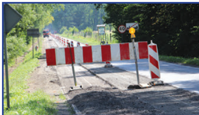
Oprócz wymiany nawierzchni przy drodze wojewódzkiej 740 utwardzono także pobocza.

Z końcem lipca, rozpoczął się remont drogi wojewódzkiej nr 740 w miejscowości Oblas. Prace obejmują odcinek od kilometra 12+940 do 14+620 i polegają na kompleksowej wymianie nawierzchni oraz utwardzeniu poboczy. W związku z trwającymi robotami drogowymi wprowadzono tymczasową organizację ruchu. Kierowcy muszą liczyć się z sygnalizacją świetlną oraz systemem wahadłowym, co może wydłużyć czas przejazdu przez ten odcinek.