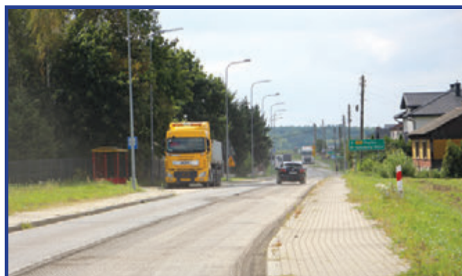
W ramach prac przy drodze wojewódzkiej 732 zostanie wymieniona nawierzchnia jezdni na ponad 5-kilometrowym odcinku drogi relacji Przytyk-Kaszewska Wola.