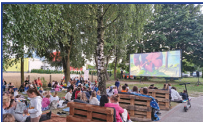
Kino dla najmłodszych.