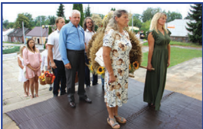
Mieszkańcy gminy Przytyk niosący wieniec dożynkowy na uroczystą Mszę św. rozpoczynającą obchody XXIII Ogólnopolskich Targów Papryki.

Trzeba przyznać, że dzień targów był kolorowy nie tylko za sprawą pięknego słońca, lecz również przeróżnych odmian papryki. Tego dnia każdy odwiedzający nasze wydarzenie mógł znaleźć coś dla siebie, a zachęcać do zakupu Papryki Przytyckiej nie trzeba było, bo wszyscy znają jej zalety.