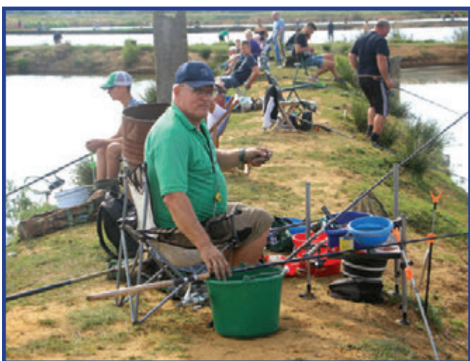
Zawody wędkarskie odbyły się na stawach rybnych w Zameczku.