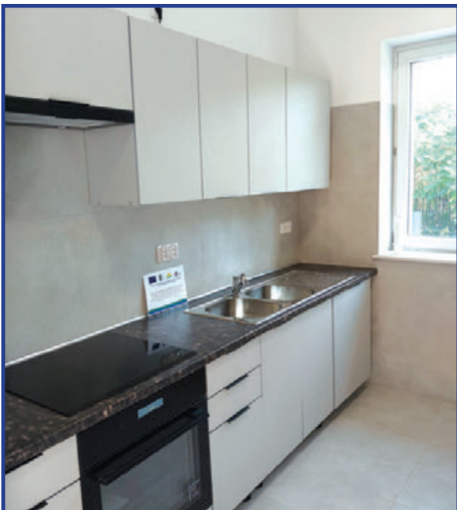
Dzięki przeprowadzonemu remontowi w budynku pojawiło się zaplecze kuchenne.