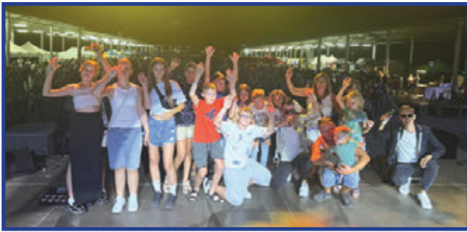
Gwiazda wieczoru - zespół Milano.