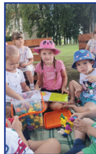
Zabawy w cieniu drzew.