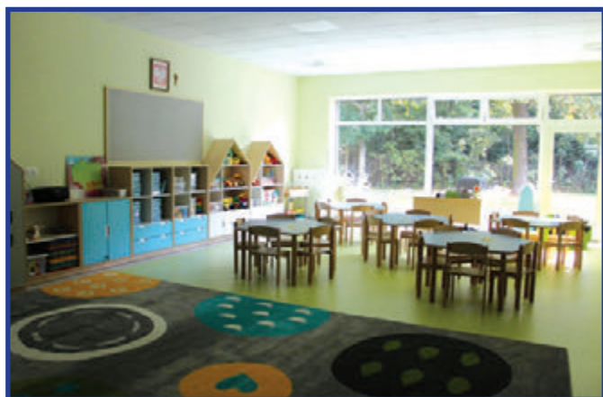
Sala dla najmłodszych przedszkolaków.