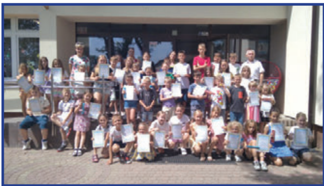
Dzieci z półkolonii we Wrzeszczowie.

Kolonie letnie i półkolonie to najpopularniejsze formy letniego wypoczynku dla dzieci. Zazwyczaj trwają od 7 do 14 dni i obejmują szereg atrakcji, takich jak wycieczki, zajęcia sportowe, zabawy, warsztaty, ogniska i wiele innych.