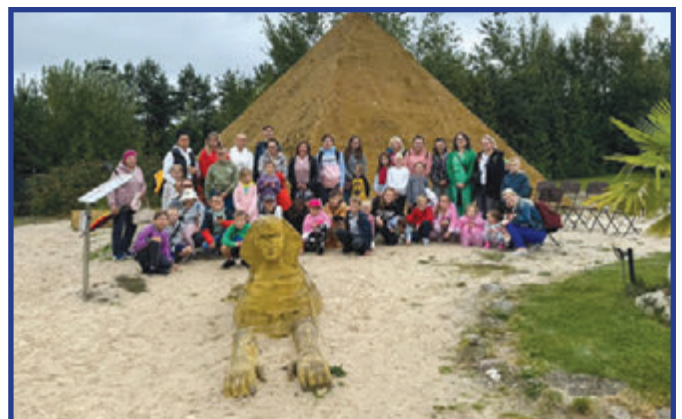
Krajno - Pałac Iluzji i Miniatur.