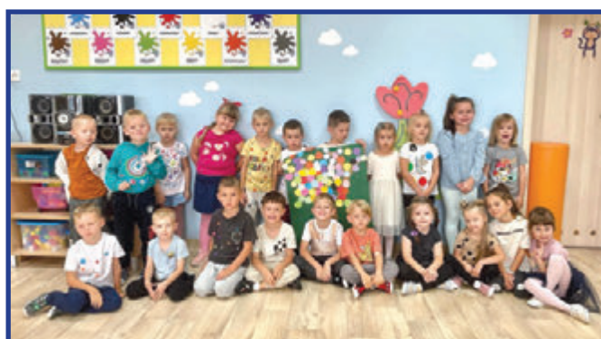
Dzień kropki w Słoneczkach.