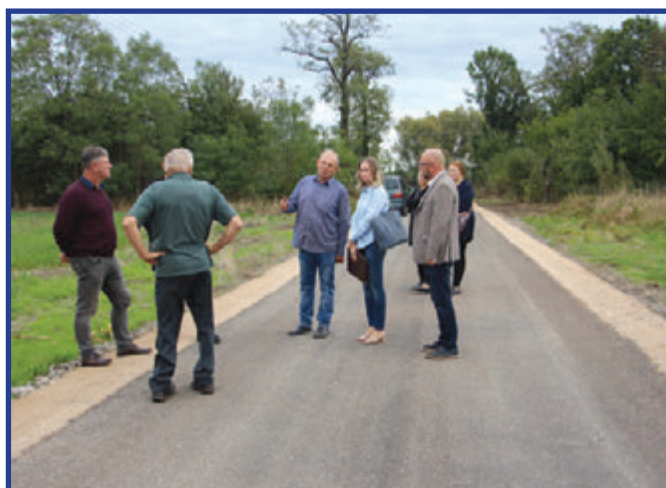
Oficjalny odbiór inwestycji.