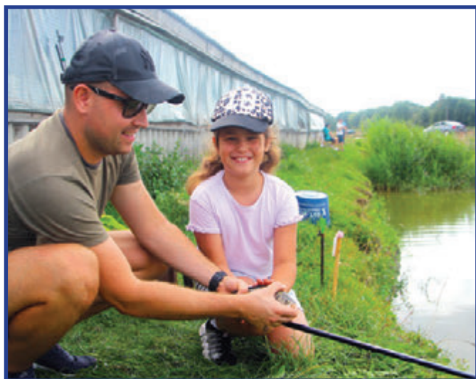
Wędkarstwo to dobry sposób na rodzinne spędzenie czasu.