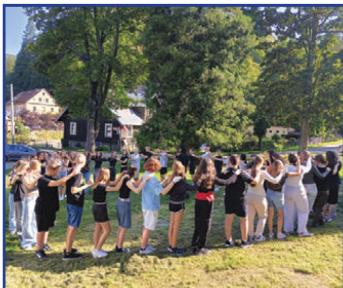
Energizer czyli poranna rozgrzewka.